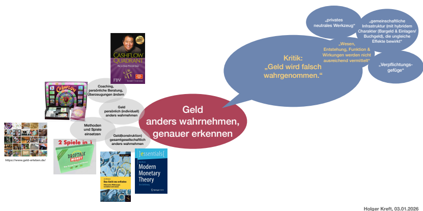
Abbildung 6: Illustration zur Geldwandelstrategie „Geld anders wahrnehmen und genauer erkennen“ (stark vereinfacht, eigene Abbildung)

Inwieweit wird das Geld möglichst nahe an der Wirklichkeit und umfassend bzw. vollständig mit all seinen Aspekten wahrgenommen? Welche Vorstellung vom Geld, welches „Geldbild“ haben wir? Wie können wir eine möglichst ganzheitliche Wahrnehmung des Geldes erreichen, so dass wir mit unserer Einflussnahme sinnvoll ansetzen können, damit das Geld unseren Werten und Zielen am besten dient?