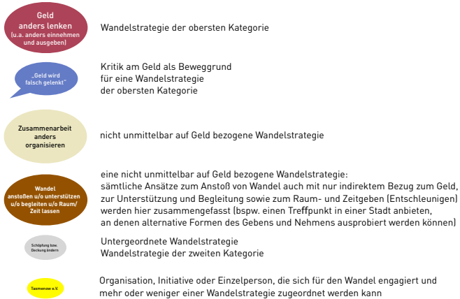
Abbildung 1: Die Übersichtskarte der Landschaft der Geldwandeliniziativen (eigene Abbildung). Wie bei allen folgenden Abbildungen sind sämtliche Begriffe bei entsprechender Vergrößerung gut lesbar.

„ersten Blick“ auf das empirische Datenmaterial festzuhalten und die gewonnenen Beobachtungen zu sortieren, zu kategorisieren und Vermutungen (Thesen) aufzustellen. Zu diesem Zeitpunkt geht es noch nicht darum, die Zusammen-