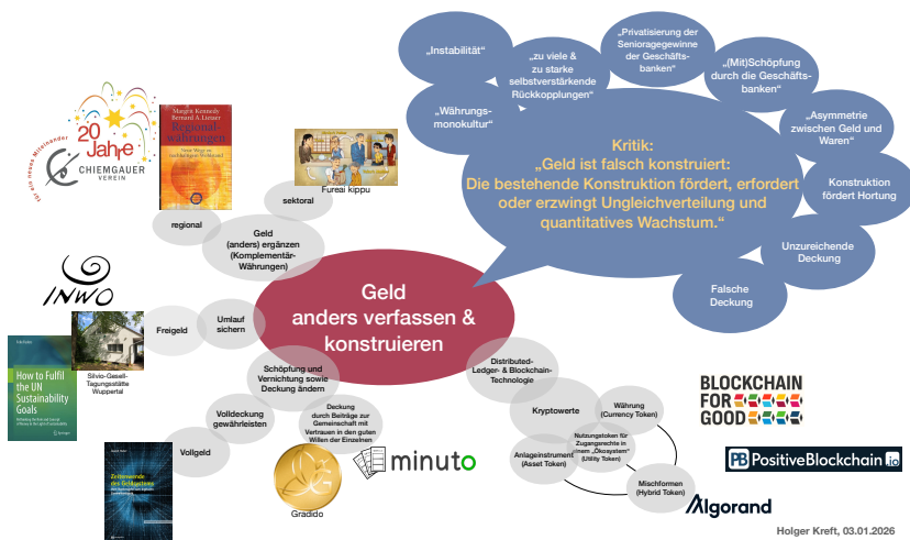
Abbildung 5: Illustration zur Geldwandelstrategie „Geld anders verfassen und anders konstruieren“ (stark vereinfacht, eigene Abbildung)

Sind Verfasstheit und Konstruktion unseres jetzigen Geldes geeignet, unseren Werten und Zielen zu dienen?