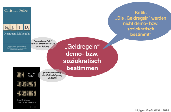
Abbildung 7: Illustration zur Geldwandelstrategie „Geldregeln demo- bzw. soziokratisch bestimmen“ (stark vereinfacht, eigene Abbildung)